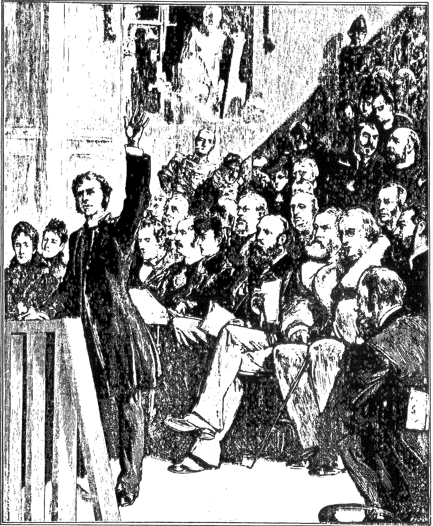
כינוס מחאה בלונדון למען יהודי רוסיה הסובלים. התקופה: שנות ה-90 של המאה ה-19. ה"ג'ואיש כרוניקל" עמד בראש הפועלים למען יהודים סובלים באשר הם שם