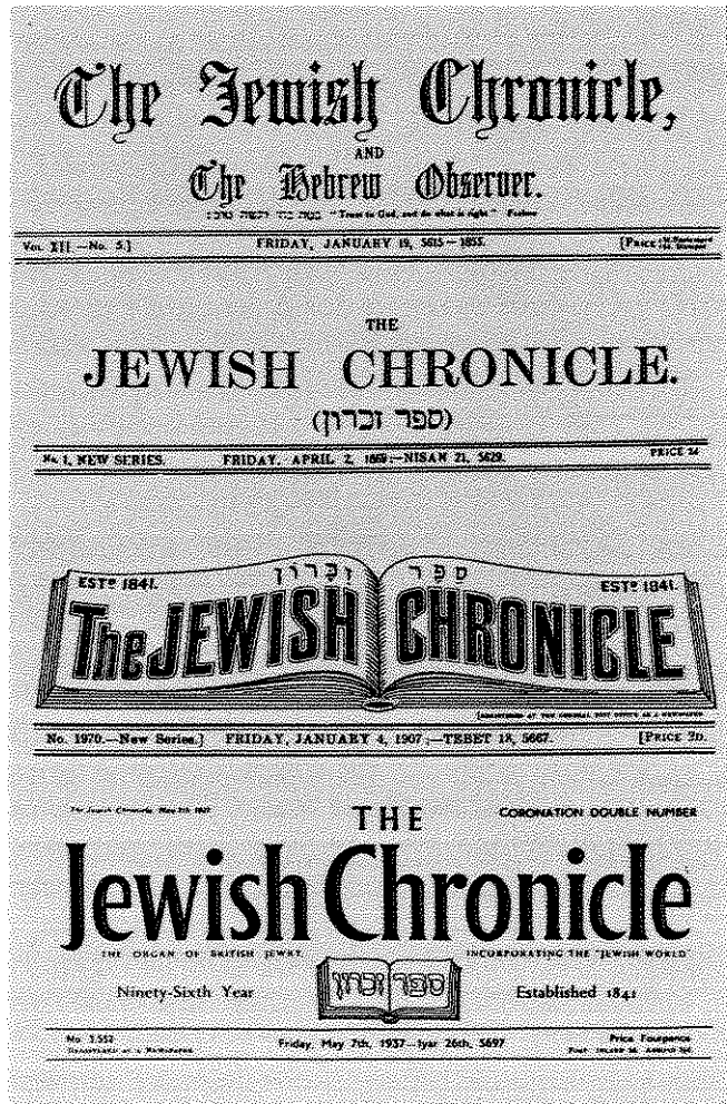
התפתחות ה"לוגו" של ה"ג'ואיש כרוניקל" (3)